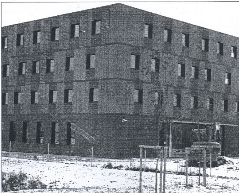
L'entrepôt composé de sept modules est équipée d'une toiture végétalisée.

Pas d'interrupteurs, la lumière s'allume automatiquement quand vous pénétrez dans une pièce ou un couloir. La température se baisse automatiquement quand une salle est inoccupée. Elle remonte à 19°C quand une présence humaine est détectée. Le chauffage se coupe également lorsqu'une fenêtre est ouverte. Le centre géré par la CCI de l'Yonne abrite une pépinière d'entreprises et le centre de formation de la chambre consulaire, qui était jusqu'alors situé dans un petit bâtiment à Saint-Denis-lès-Sens, et l'Ecole de gestion et de commerce qui bénéficie désormais d'un formidable écrin. L'espace a été optimisé et rationalisé dans les quatre niveaux conçus de manière identique. Le rez-de-chaussée abrite des locaux communs au pôle formation et à la pépinière d'entreprises avec une grande salle de conférence. Le premier étage au ton bleu est dédié au centre de for-